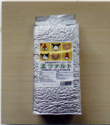
孟ツアルト 成長促進用孟宗竹パウダー