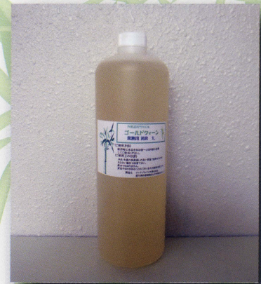
ゴールドクィーン 成長促進用孟宗竹エキス